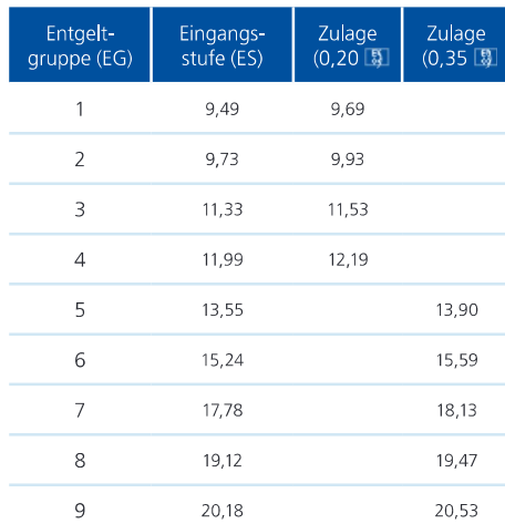
Entgelttabelle Ost (ab 01.10.2019)