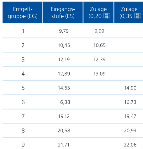
Entgelttabelle West (ab 01.10.2019)