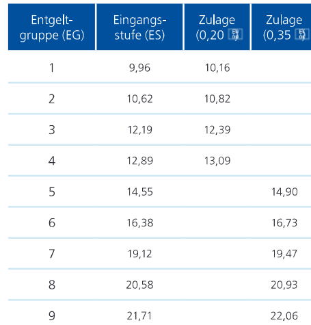
Entgelttabelle Ost (ab 01.04.2019)